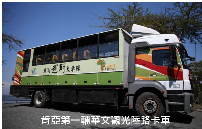
肯亞第一輛華文觀光陸路卡車