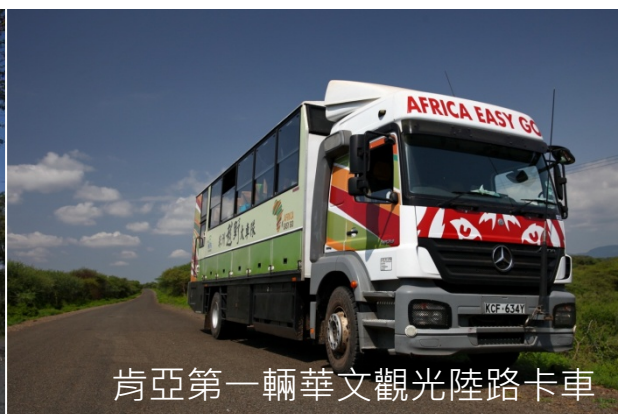
肯亞第一輛華文觀光陸路卡車